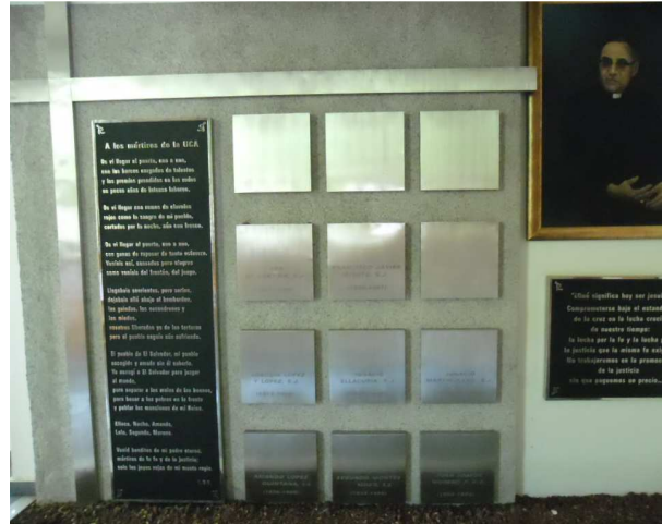
Gedenktafel der Ermordeten in der Kirche der UCA

zieher des Verbrechens vorzugehen. Ein offizielles Vorgehen wurde aber in Spanien auch durch ein Amnestiegesetz verhindert, das zwar gedacht war, um die Folgen des spanischen Bürgerkriegs vergessen zu machen, sich aber in diesem Fall als sehr hinderlich erwies.