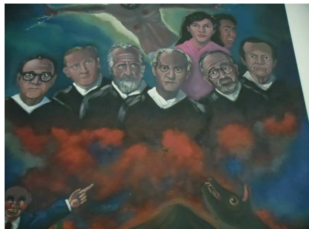
Bild der Ermordeten

Der November des Jahres 1989 war in Deutschland der Monat des Mauerfalls. Deswegen gab es hier damals wenig Aufmerksamkeit für eines der grauenvollsten Geschehnisse des Bürgerkriegs in El Salvador: