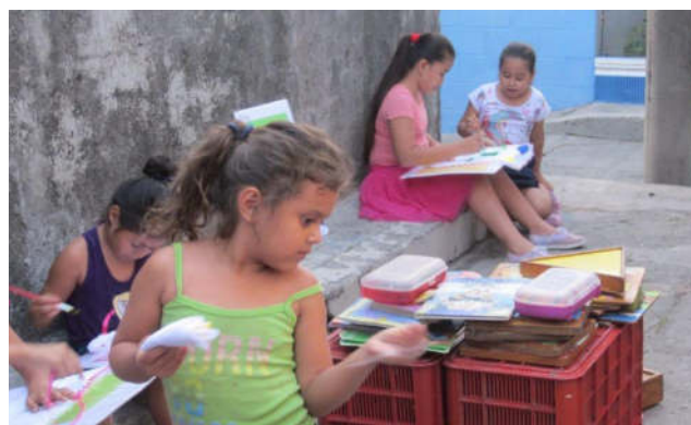
Kinder in El Salvador