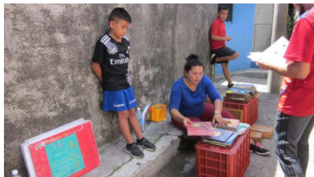
Schule unter freiem Himmel

Gelegenheit hatte, das Lieblingsessen fast aller Salvadorianer, nämlich Pupusas, zu probieren. (Pupusas sind Tortillas, also Maisfladen, die mit allen möglichen Zutaten gefüllt und zubereitet werden.) Dann ging es weiter nach Hause, wo ich nach dem langen Flug erst einmal todmüde ins Bett fiel.