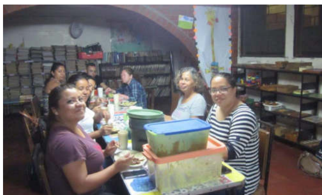
Mitarbeitende in den Projekten

hatte Gelegenheit, die Arbeit in der Clínica kennen zu lernen und zwei Besuche auf der Finca zu machen. Auch in der Bibliothek war ich mehrmals, und ich habe das Team der „Schule unter freiem Himmel“ bei der Vorbereitung und der Durchführung der Tagesaktivitäten begleitet. Ich konnte an Sitzungen der Mitarbeitervertretung und des Trägervereins teilnehmen, ebenso wie an der wöchentlichen Besprechung der Lehrerinnen und Lehrer. Ich war beim Computer-Unterricht dabei und habe am monatlichen Projektvormittag der Schule teilgenommen, den Schulbus begleitet und die Küche besucht. An einigen Nachmittagen hatte ich auch die Gelegenheit, die Lehrerinnen bei den Besuchen in den Familien einiger Schülerinnen und Schüler zu begleiten, was mir besonders eindrücklich in Erinnerung geblieben ist. Zudem sah mein Programm an sehr vielen Tagen ein gemeinsames Abendessen mit einem der verschiedenen Teams vor, wo nochmal Gelegenheit zu privatem Austausch in kleinerer Runde gegeben war.