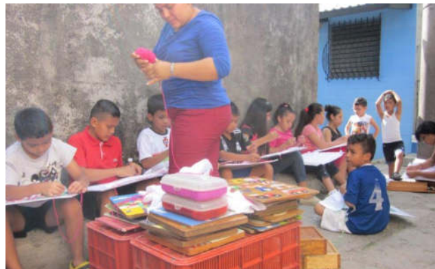
Schule unter freiem Himmel

Es würde zu weit führen, dies alles an dieser Stelle ausführlich zu beschreiben. Die Tage waren für mich intensiv und angefüllt von früh bis spät. Carolina war für mich in dieser Zeit eine wertvolle Hilfe, weil ich vieles, was ich tagsüber gesehen hatte, mit ihr abends nochmal besprechen und auch in größere Zusammenhänge einordnen konnte.