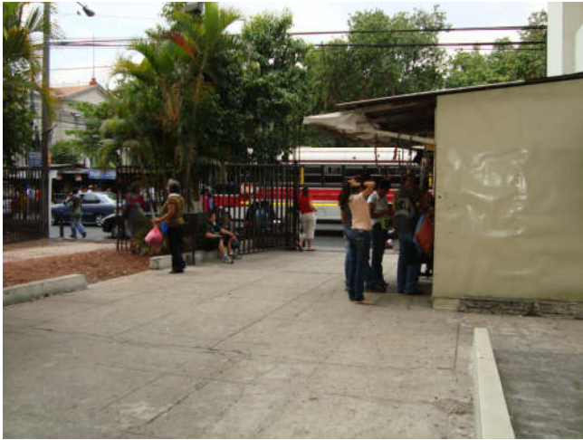
Straßenbild San Salvador

reichsten Länder der Erde wäre. Das wäre dann ein positiver Ausnahmezustand!