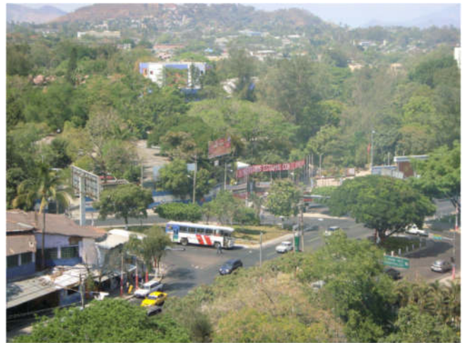
Blick auf San Salvador

Eine solche Wiederwahl ist zwar in der Verfassung eindeutig verboten, aber vor einem Jahr haben die von der Präsidentenpartei „Nuevas Ideas“ ins Amt gehievt Verfassungsrichter tatsächlich eine neue Idee gehabt und dieses Verbot kurzerhand außer Kraft gesetzt. Ob das juristisch überhaupt möglich ist, wird angezweifelt und bestritten.