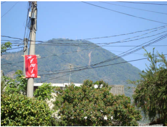
Blick auf den Vulkan San Salvador

Wenn man erfährt, dass das Nationale Statistikamt einfach aufgelöst wurde, nachdem es eine signifikante Zunahme der Armut in El Salvador festgestellt hatte, ist das Vertrauen in diese Zahl nicht mehr so groß.