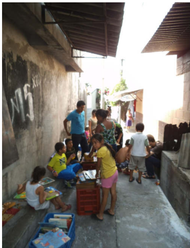
Schule unter freiem Himmel, links mit einem Graffito der Mara Salvatrucha (MS) auf der Wand, Foto von Martin Schmidt-Kortenbusch, 2013

Dieses Projekt ist auch durch den Ausnahmezustand – Angst vor Polizei und Militär – beeinträchtigt. Daher begleiten Lehrkräfte oft ganze Familien dorthin, damit die Kinder kommen und alle sich sicherer fühlen. Als Ort für Kinder und Erwachsene, die Neues lernen wollen, ist sie nach wie vor gefragt und stellt einen Ort des Austauschs und der Gemeinschaft dar.