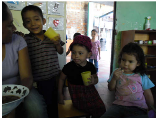
In der Guarderia (Kindertagesstätte)

Der Wiedereinstieg nach den Beschränkungen durch die Pandemie war ebenfalls schwierig, weil es immer noch Ängste vor Ansteckung gibt. Hinzu kam eine Welle von Erkältungen. Viele Mütter arbeiten als Verkäuferinnen und können ihre Kinder nicht betreuen, deshalb müssen diese auch mit Schnupfen in die Kindertagesstätte aufgenommen werden, wo dann viele Ansteckungen erfolgen. Denn die meisten Kinder sind 2-3 Jahre alt und tragen deshalb keine Maske. Auch die Kindertagesstätte führt wieder Ausflüge durch (z.B. zum Fußballplatz).