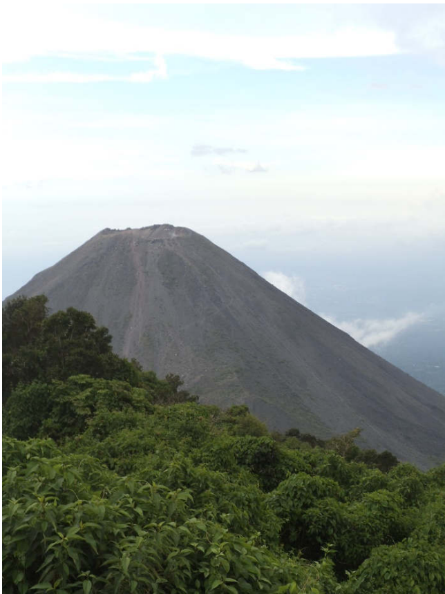
Titelbild: Vulkan Izalco