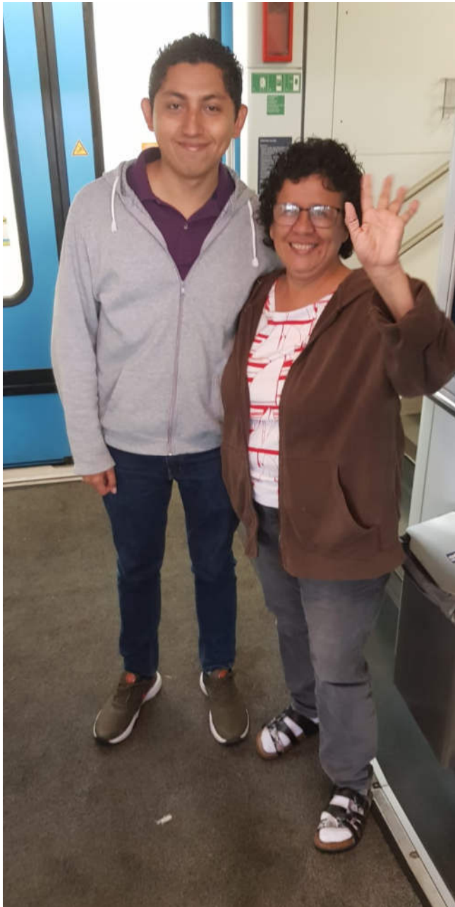
Abschied aus Braunschweig

In den Arbeitsgruppen stimmten wir in unserer Einschätzung überein, dass es nötig wäre, etwas für die Wiederaufnahme von Freiwilligendiensten in unseren Projekten zu tun. Denn an allen Orten, die wir besucht haben, wurde die Sorge geäußert, dass junge Leute fehlen, die sich aktiv in die Solidaritätsarbeit einbringen.