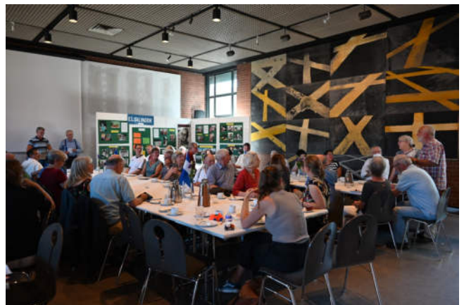
Vorstellung der Gruppen

Der große Saal der Pfarrgemeinde St. Albertus Magnus war gut gefüllt. Es gab etwas zu feiern, und darauf hatte sich der Freundeskreis El Salvador schon seit über einem Jahr vorbereitet. Am Samstag, dem 16.09.2023, war es dann so weit. Mitglieder des Freundeskreises von Nah und Fern, von anderen El Salvador-Solidaritätsgruppen, eine Lehrerin mit Schülerinnen als Vertretung der Schulpartnerschaft der IGS Franzches Feld, Gemeindemitglieder und Interessierte waren da.