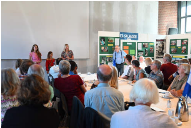
Vertreterinnen der IGS Franzisches Feld

mit kubanischer Backgroundmusik und angeregten Gesprächen aus. Damit war das Fest aber noch nicht beendet.