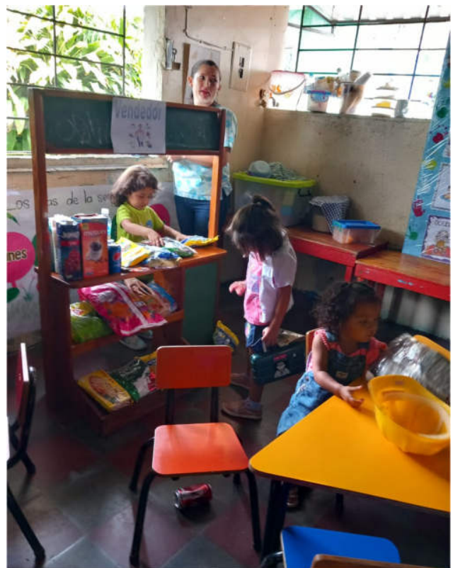
Der Kaufmannsladen in der Kindertagesstätte