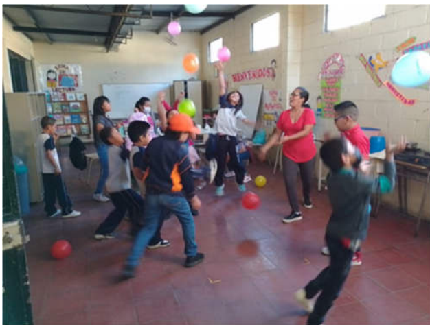
Bewegungsspiele in der Schule

„Die Lebensmittel, die für das Schulessen verwendet wurden, werden auf der Finca organisch angebaut, so z.B. Gemüse, Obst und Salat. Es wurden auch die Eier und das Fleisch der Hühner auf der Finca verwendet. Einige Lebensmittel wurden auch en gros in einem Großmarkt eingekauft.“