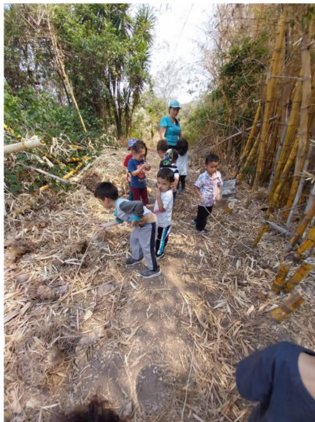
Ausflug zur Finca

Das Schuljahr wurde mit 93 Schülerinnen und Schülern beendet, da neun von ihnen aufgrund der oben erwähnten Schwierigkeiten die Schule verlassen hatten.