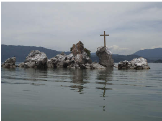
Insel vulkanischen Ursprungs im Ilopango-See, San Salvador