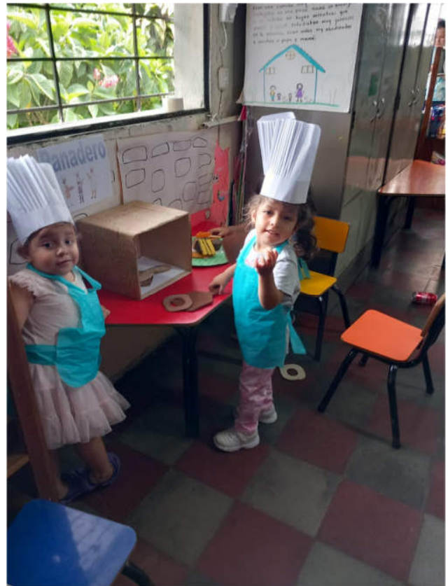
Kochspiel in der Kindertagesstätte