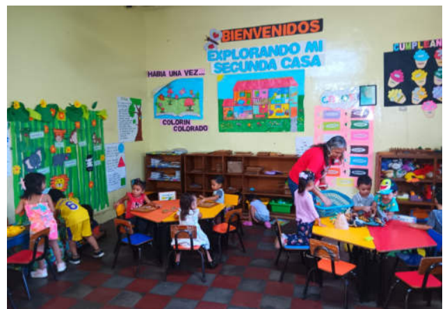
Kindertagesstätte in den Projekten

Die Kindertagesstätte („Zentrum für frühkindliche Entwicklung 22. April“) begann im Jahr 2023 mit 10 bis 12 Kindern. Deren Zahl stieg im Laufe der Monate schließlich auf 32 Anmeldungen an. Täglich kamen durchschnittlich 20 bis 25 Kinder. Das wurde durch unterschiedliche Aktionen und die engagierte Arbeit der Kindertagesstätte erreicht. Anfänglich haben die Mütter und Väter deren Arbeitsweise skeptisch gesehen und die gut geplanten Aktivitäten des Lehrpersonals, die ein ganzheitliches Lernen ermöglichen, nicht wertgeschätzt. Ihnen war es eher wichtig, mit der Kindertagesstätte einen Ort zu haben, an dem gut auf die Kinder aufgepasst wird. Dieses Problem wurde an Elternabenden erörtert, eine gute Kommunikation mit den Eltern wurde über WhatsApp geschaffen und schließlich haben sie die Lernfortschritte ihrer Kinder selbst wahrgenommen, so dass die Akzeptanz der Arbeit der Kindertagesstätte stieg und die Besuchszahlen durch die Kinder anwuchsen.